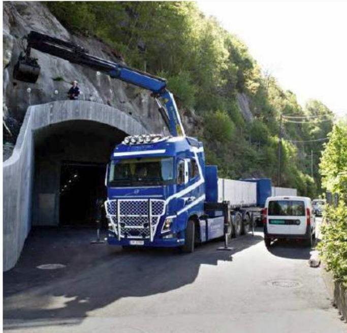
SMEKK: Det var blant annet transport av kloakkslam fra dette anlegget i Ytre Sandviken de to selskapene skulle utføre for Bergen Vann. Nå er de ilagt kjelekkelige gebyrer for å hindre priskonkurranse.