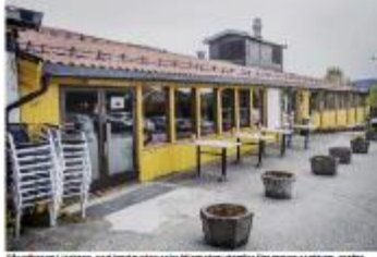
Bygningen i Lyngdal, ved Landeveien 100, ble utbyttet av bedrifter som samarbeidet om å bytte ut gamle lyskilder med LED-lys i skolehuset.