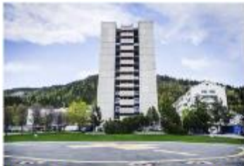
Elektromontørene ble utbyttet av bedrifter som samarbeidet om å bytte ut gamle lyskilder med LED-lys i skolehuset.